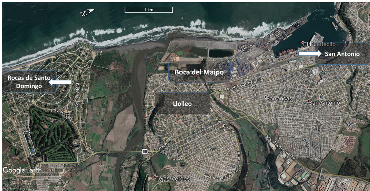
Figura 1. Imagen satelital de la desembocadura del río Maipo