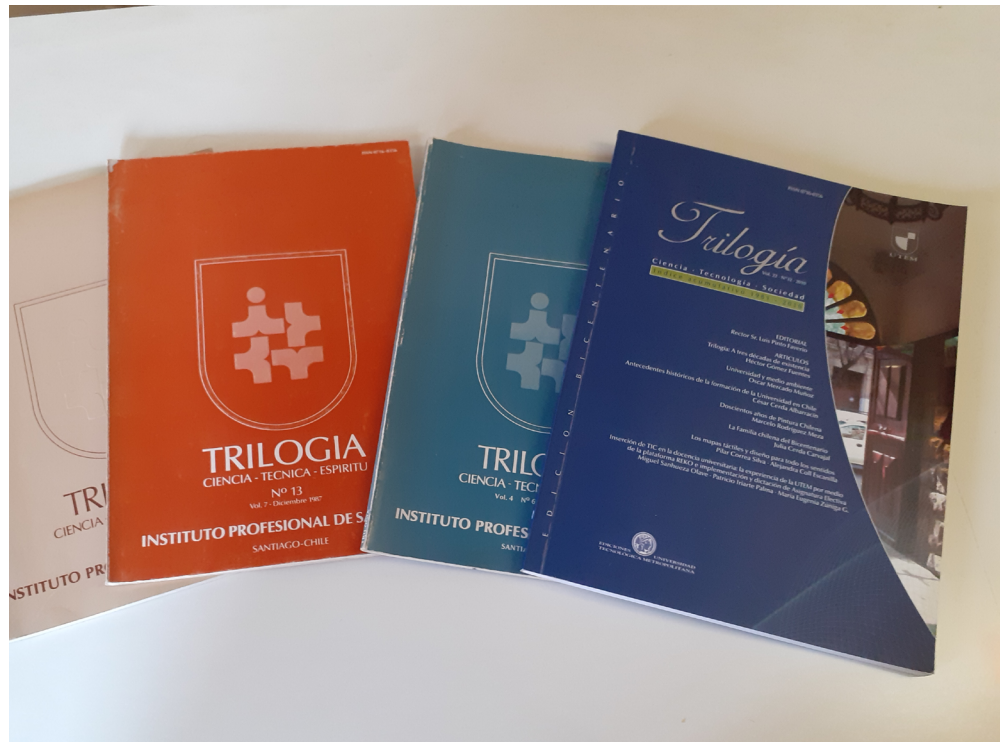
Fotografía 1. Revista Trilogía, portadas 3 , 1981-2010