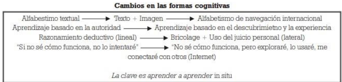
Ilustración 1: Cambios en las formas cognitivas adolescentes.