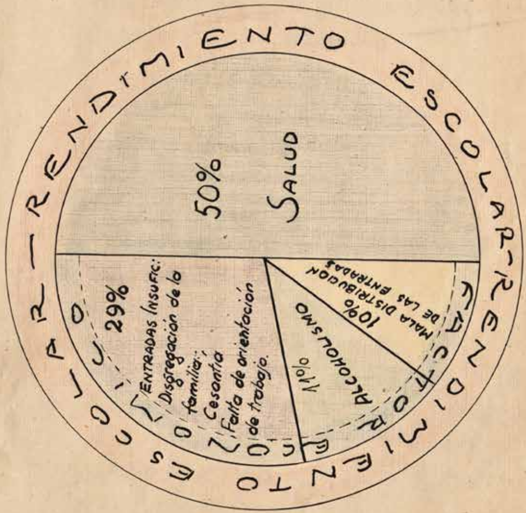
Gráfico N: 1.-